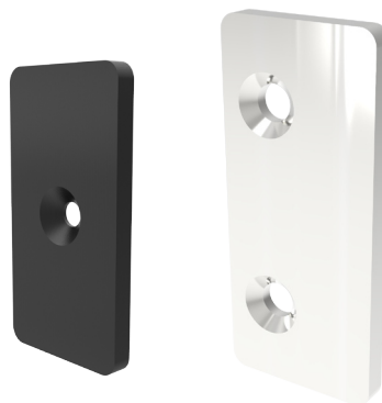
PIASTRA IN PLASTICA P1830

Regolazione della corsa: estrarre il meccanismo interno dal lato cerniere per circa 3 cm ed avvitare (per diminuire) o svitare (per aumentare) il pulsante di spinta. Inserire il meccanismo interno fino alla posizione di blocco. Trovare la corretta posizione simulando dei cicli di apertura e chiusura della porta.